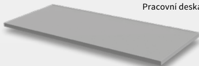
Pracovní deska bez lemu