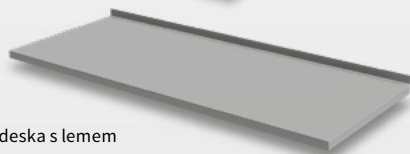
Pracovní deska s lemem

GN 3100 TN Akční cena 27 900 Kč 32 740 Kč